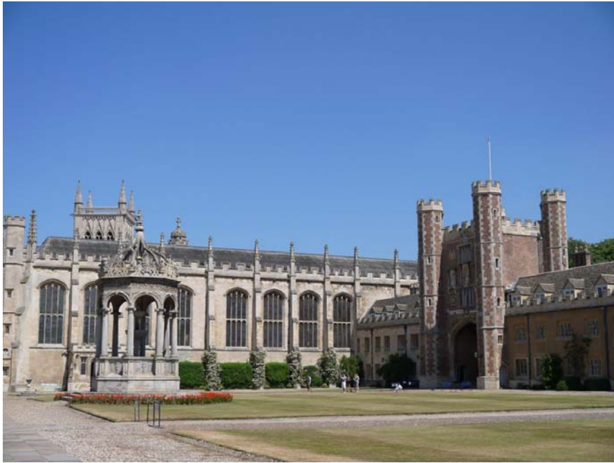
圖六 劍橋大學一隅—牛頓故居

了位於倫敦的劍橋大學，特別是劍橋大學中的李約瑟研究所，並與李約瑟研究所的學者們共度下午的美好時光。