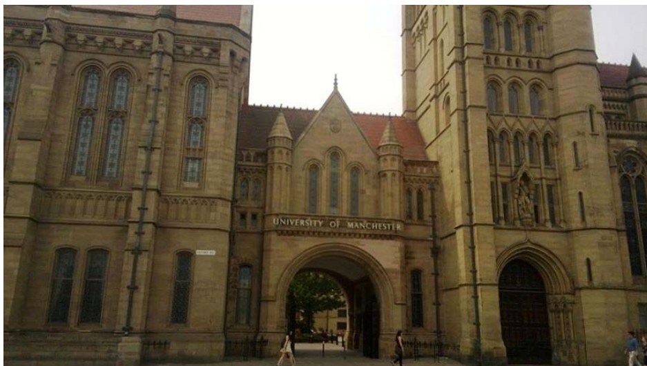
圖一：城堡般古色古香的曼徹斯特大學

曼徹斯特大學位於城市的邊緣，少了許多喧囂，並多了幾分書香與寧靜。而校園中，頗令人稱羨的是該校數學系所在的圖靈館（Alan Turing Building），此館主要紀念同樣曾在此任教過的電腦科學之父圖靈（Alan Turing）。而這棟研究大樓共有 5 層樓，占地約 17000 平方公尺，偌大的建築中，三樓為數學系所在。曼徹斯特大學的數學系，大約包含了 80 個教授與相學術研究人員、200 個研究生以及 400 個大學生。