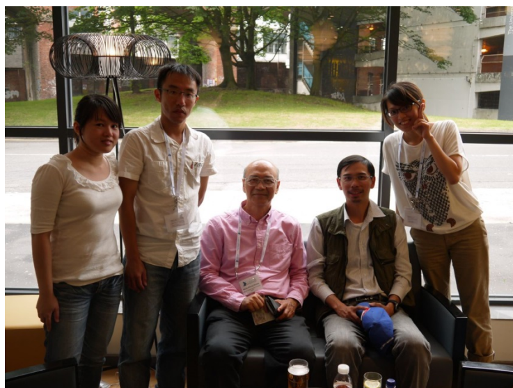
圖五：台灣 HPM 團隊參與成員

不過，對於筆者而言，比較美中不足的是，中國與日本研究和算的學者們，皆未參與此次盛會，也因此錯失了交流與認識這些學者們的機會。