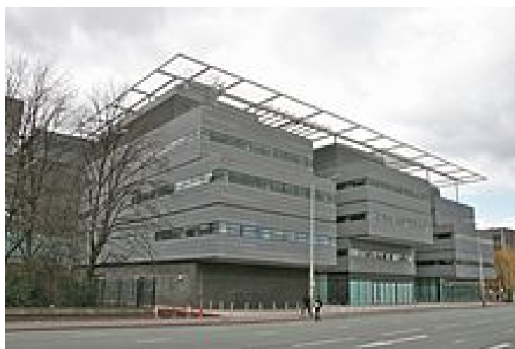
曼徹斯特大學數學系所在—圖靈館 7

曼徹斯特大學位於城市的邊緣，少了許多喧囂，並多了幾分書香與寧靜。而校園中，頗令人稱羨的是該校數學系所在的圖靈館（Alan Turing Building），此館主要紀念同樣曾在此任教過的電腦科學之父圖靈（Alan Turing）。而這棟研究大樓共有 5 層樓，占地約 17000 平方公尺，偌大的建築中，三樓為數學系所在。曼徹斯特大學的數學系，大約包含了 80 個教授與相學術研究人員、200 個研究生以及 400 個大學生。