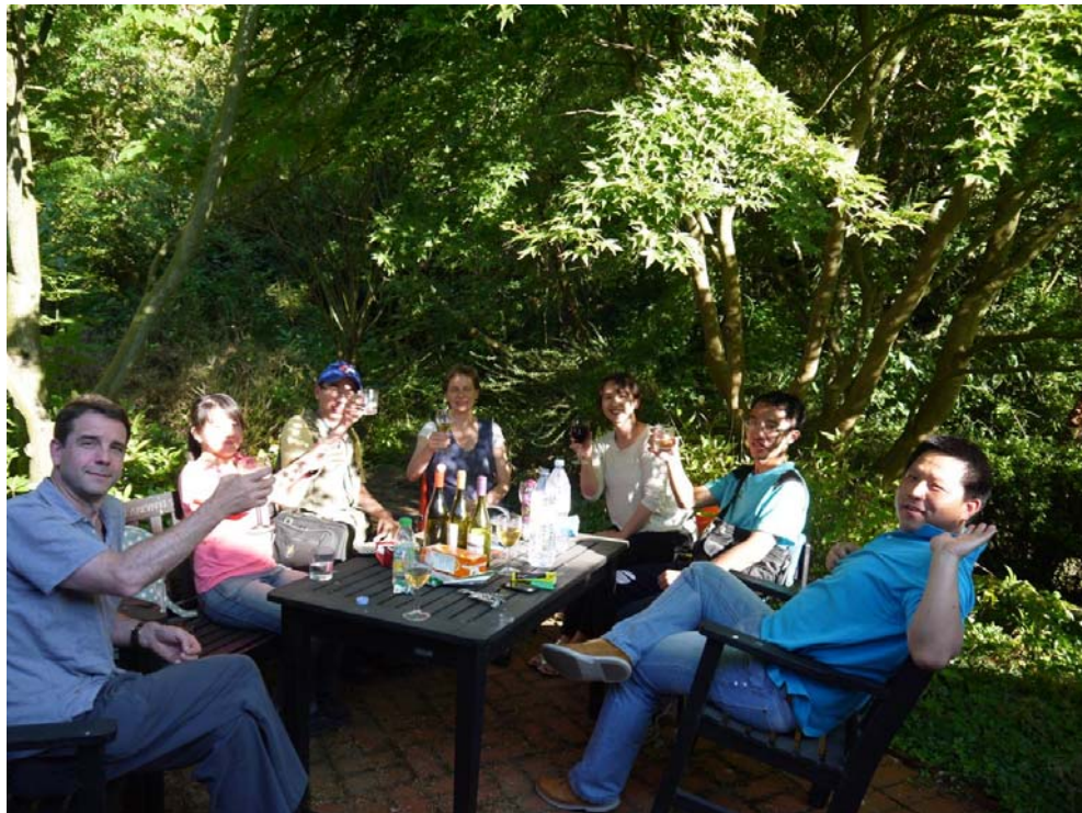
圖七 拜訪劍橋大學李約瑟研究所